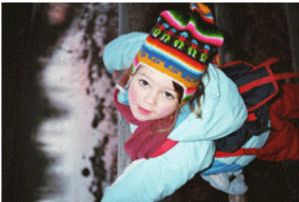
Überblick von unten<|>2007