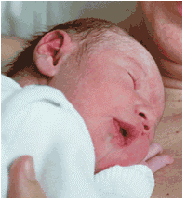
Neues Leben ©Samiran Markgraf<|>2007